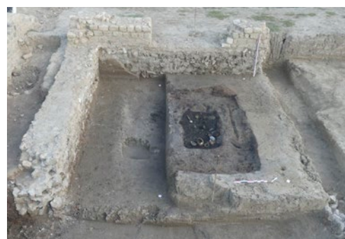
Les incinérations sont majoritaires dans la nécropole de la Robine. Ici, une tombe bûcher avec des résidus de crémation au centre de l'enclos