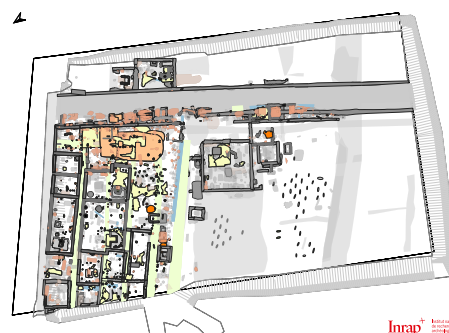
Plan de la fouille de la nécropole antique de la Robine à Narbonne