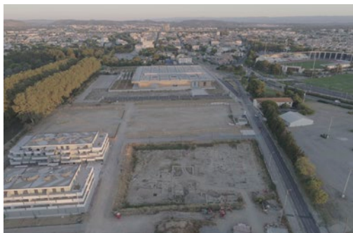
Vue générale des berges de la Robine: au premier plan, la fouille ; au second plan, le musée Narbo Via