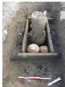
(gauche) Plusieurs triclinia découverts dans la nécropole de la Robine documentent la pratique du banquet.