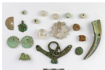
Amulettes (perles, dent animale, pendentif phallique) retrouvées dans une tombe d'enfant de la nécropole de la Robine