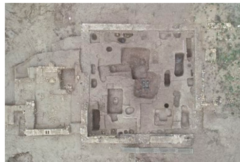
Vue aérienne d'enclos avec bûcher en cours de fouille (2018) sur la nécropole de la Robine à Narbonne