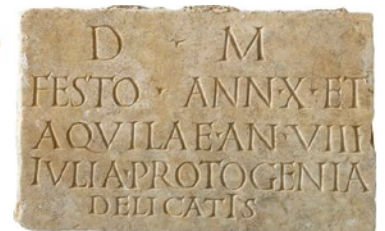
Plaque en marbre épigraphique portant les noms de Festus et Aquila âgés de 10 et 8 ans.