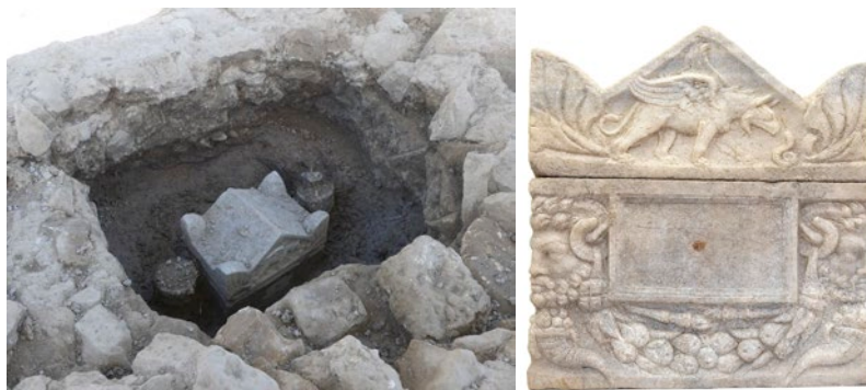
Un coffre en marbre sculpté, avec cuve et couvercle ornés de créatures mythologiques, découvert dans une tombe de la nécropole de la Robine