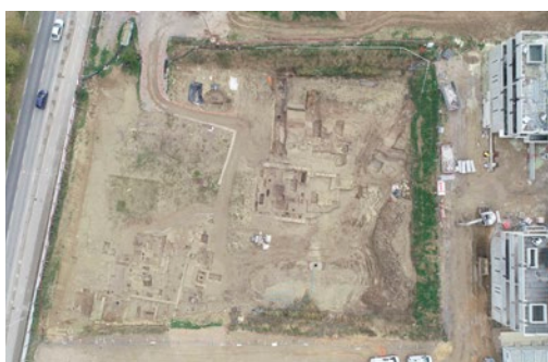
Vue aérienne de la fouille de la nécropole antique de la Robine à Narbonne en août 2020