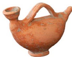
Biberon en céramique