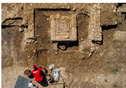
Vue d'un monument funéraire découvert lors de la fouille de la nécropole antique de la Robine