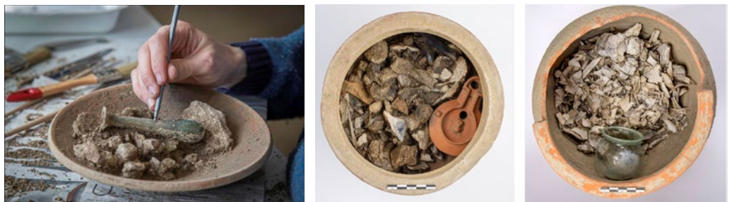
La fouille des vases ossuaires a permis de comprendre les rites funéraires en usage dans la nécropole de la Robine. Les os crévés étaient accompagnés de dépôts mobiliers, tels que des balsamaires, des lampes à huile ou des récipients en verre