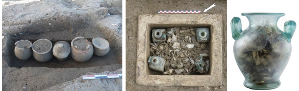
Suite à l'incinération, les os brûlés des défunts étaient placés dans des récipients en céramique (à gauche), en pierre (au centre) ou en verre (à droite).